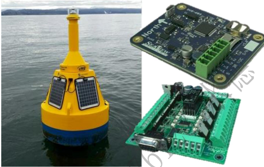
SVS-603HR Wave Sensor

SVS-603HR 波高传感器是 SVS-603 高精度波高传感器的增强版，通过 RS-232 或日志向其车载数据记录器报告航向、波浪高度、波浪周期和波浪方向等数据。